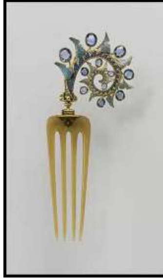
شكل ( ٣ )