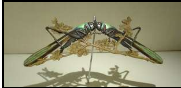
شكل ( ٢ )

حيث قدم لاليك مجموعة من أمشاط ودبابيس الشعر من خامات مختلفة مستوحى من أوراق الشجر والطحالب والشعب المرجانية واجنحة الطيور ووجه المرأة والفراشات والنحل بأسلوب التفرغ والصب والسلك والزنكوغراف المينا وتركيب الأحجار الكريمة بها ليونة فى الحركة ويتضح فيها دور الخطوط اللينة المنحنية وعلاقتها ببعضها البعض ومن حيث تشابكها وتداخلها وما حصرتة من فراغ أكد التفرجات والأشكال الناشئة عنها الى جانب الاهتمام بالثراء اللونى الذى اظهر قدرة المصمم على استثمار العديد من الخامات فى المشغولة المعدنية الواحدة كذلك تناسب حجم المشغولة لوظيفتها والتنوع الموجود بداخل كل قطعة .