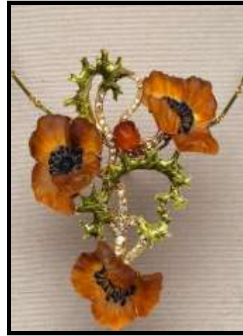
شكل ( ٤ )