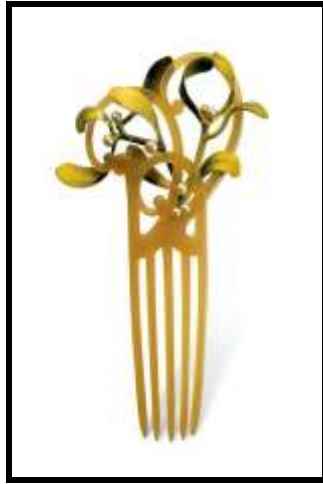
شكل ( ٥ )

http://www.boston.com/lifestyle/fashion/gallery/17nouveau?pg=4 -