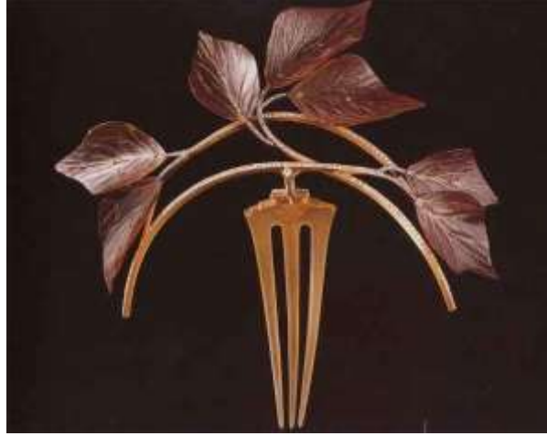
شكل ( ١ )

- http://barefootedcontessa.blogspot.com/2010_12_01_archive.html